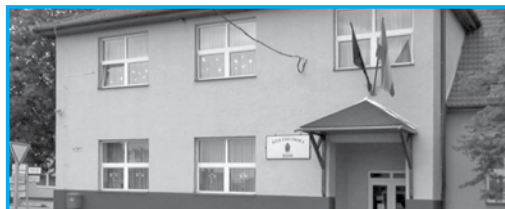
Általános Iskola épülete

19:30 ÓRAKOR A „DÁVODI MŰVÉSZEK ALKOTÁSAI” KIÁLLÍTÁST megnyitja Hirtenberg János Sándor polgármester. A kiállítás elnevezése is mutatja, hogy a helyszínen dávodi művészek alkotásait tekinthetjük meg! A tárlaton láthatunk többek között festményeket, rajzokat, fotókat, szobrokat.