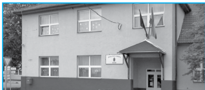
Általános Iskola épülete

Nyitva tartás: 8:00-12:00 óráig 13:00-17:00 óráig