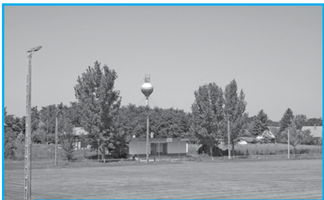
Az új műfüves Sportpálya

SZOMBAT REGGEL 8:00 ÓRAI KEZDETTEL „a 102/2012. (X.1) VM rendelet alapján a Falumegújítás, fejlesztés 5. célterülete a 2076452112 azonosítószámú - „Műfüves sportpálya építése Dávodon,, elnevezésű - pályázat keretében megépített MŰFÜVES SPORTPÁLYA ÜNNEPÉLYES ÁTADÁSA LESZ MEGTEKINTHETŐ A „FOCIPÁLYÁN”.