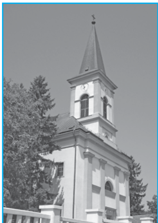
Római Katolikus Templom